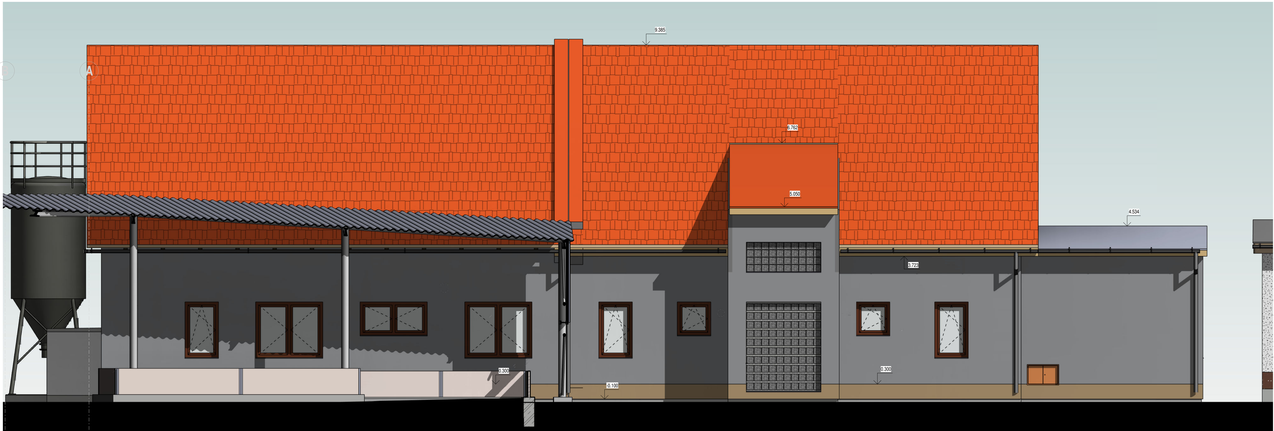
POHLED OD SEVEROVÝCHODU 1 : 50