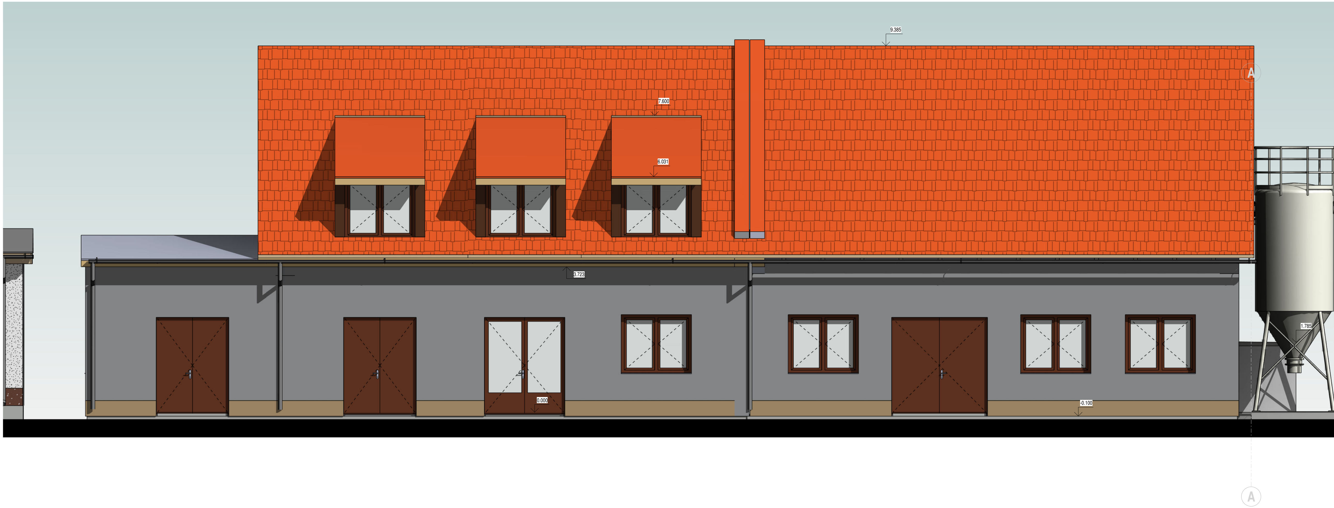
POHLED OD SEVEROVÝCHODU 1 : 50